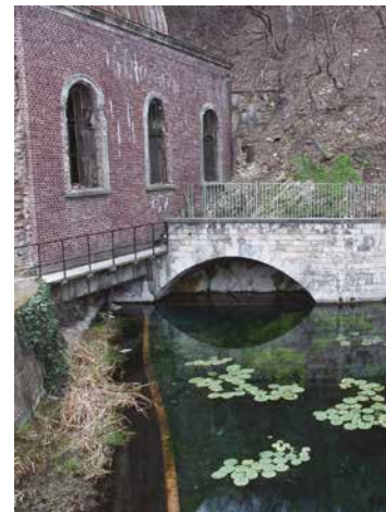
Kocsis Ákos: Malom-tó (Frankel Leó út)