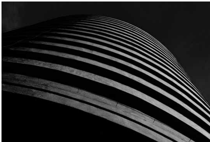
Iván István: Körbe-körbe (Budapest Körszálló)