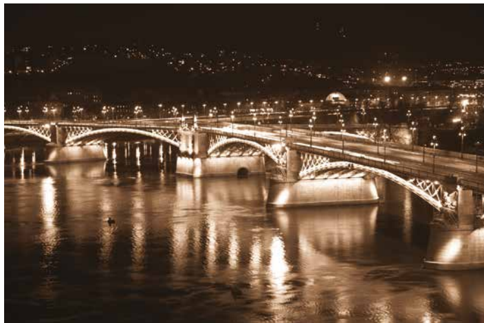
Kerületünk a Margit híd felől

Az év legjobban sikerült felvételei 2017