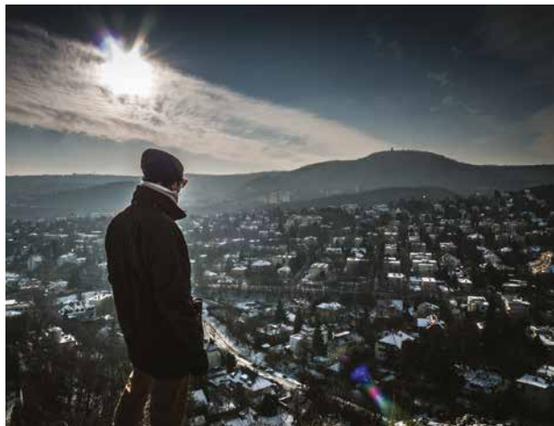
Juhász István: Tesz-vesz város (Apáthy-szikla)

Az év legjobban sikerült felvételei 2015