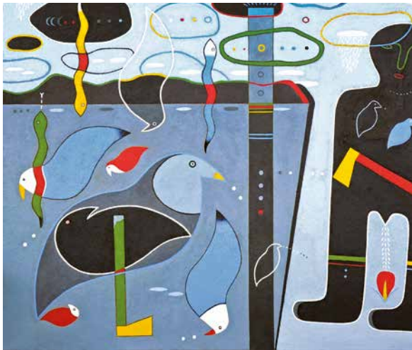
Darázs József: Egy favágó álma, 2018 akril, farost, 100x100 cm