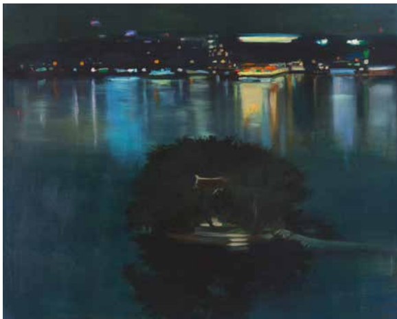
Öry Annamária: Sziget , 2017, olaj, vászon, 100×120 cm

„A sziget a földtani alakulatok közül a magányos, a különc, a társtalan lény, aki nem szorul másra. Mindenre rányomja bélyegét. Önálló életet él, akár az eleven szervezet.”