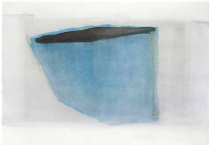
Krajcsovics Éva: Sziget , 2016, akvarell, papír, 50×70 cm