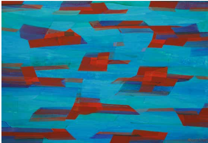
Szegedi Csaba: Flow M12 (Goa), 2018, akril, farost, 70x100 cm