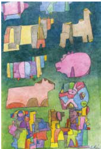
Organikus – geometrikus és antropomorf figurák*