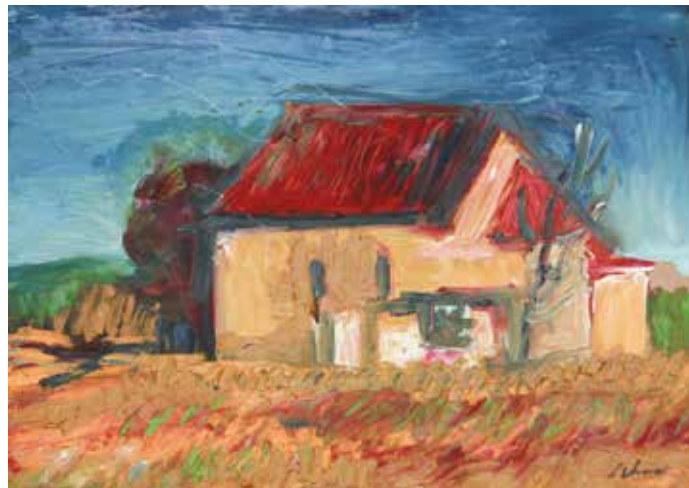
Gercsei templom, 2003, olaj, fa, 50 x 70 cm

1964-től rendszeresen állított ki hazai és külföldi, egyéni és csoportos tárlatokon (Párizs, Hamburg, Varsó, Szófia, Bécs, Berlin)