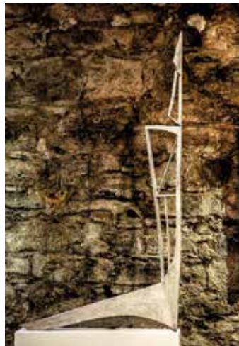
Kalmár János: Lelki Gravitáció II , 2014, bronz, 135x90x30 cm