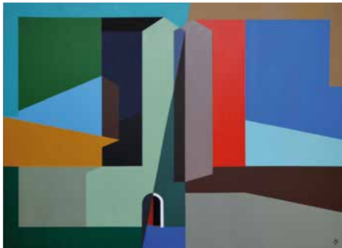
Aknay János: Emlék II. , 2014, akril, vászon, 130×180 cm