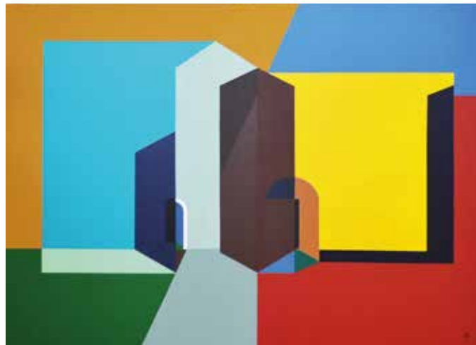
Aknay János: Emlék I., 2014, akril, vászon, 130x180 cm