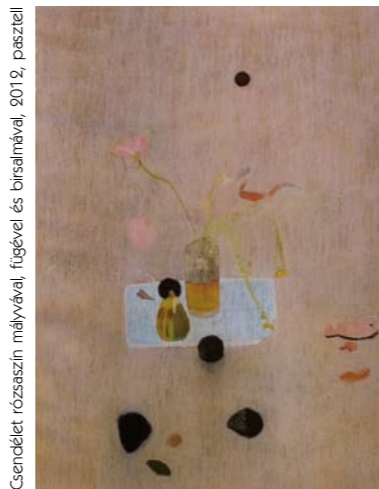
Csendélet rózsaszín mályvával, fügével és birsalmával, 2012, pasztell

Magyar Alkotóművészek Országos Egyesülete Magyar Képzőművészek és Iparművészek Szövetsége