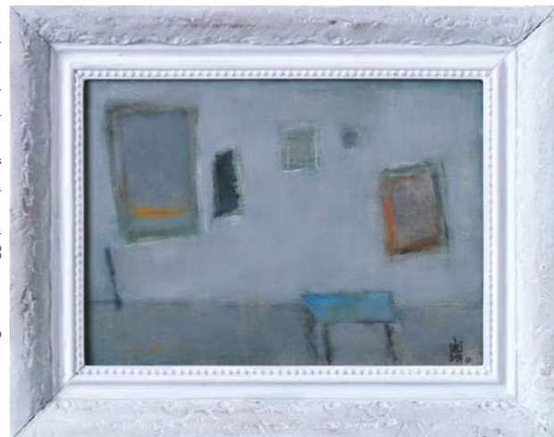
Műterem - hideg februári reggel, 2004, olaj, farost, 28,5 x 40,3 cm