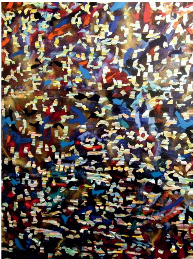
Végi Péter – Térben, 2011; olaj, vászon; 200x150 cm

Absztrakt festészetének célja a rá jellemző médiumokkal a művészi módszereket, elemeket önállóítani és azokat témává tenni. Munkafolyamatát a sorozatokban készített akvarellek és olajképek párbeszéde alakítja. Festményeit egy esztétikailag megfontolt mozdulatrendszerrel való komponálás jellemzi ahol a kimaszkolt felületek fokozák az ismétlések energikusságát. Képeinek stiláris módszere képes magába foglalni, a késő modernizmus elméleteit is, amely szerint a szín, a gesztus, a mozdulat maga, természetreferencia nélkül is elegendőek ahhoz, hogy a kép valóságát, a festményképzési elemeket elfogadja.