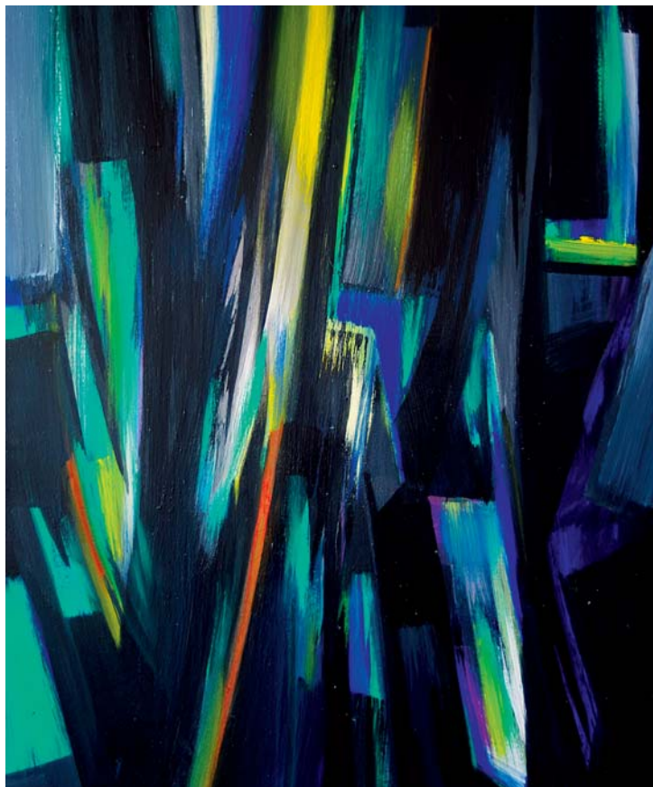
Esse Bánki Ákos – Szín-tér sorozat; 2011; olaj, vászon; 50x40 cm

Az absztrakción belül lírai absztrakció, aminek jelei megmutatkoznak festményeimen. A képeimben az absztrakt festői nyelv nem konkretizált többrétű értelmezést ad a képnek, nem szűkül le a tartalom egy meghatározott, önkényes mondanivalóra. Tudatalatti és a tudatos asszociációk vannak jelen. Nem érzem szükségét a jelentés kizárólagosságának. Célom a festőiség létrehozása.