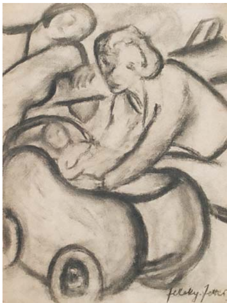
Feleky Fetter Frigyes – Anyai szeretet; 1930-as évek; szénrajz; 33,5x26 cm

Feleky Fetter Frigyes (1899, Kolozsvár – 1997, Budapest)