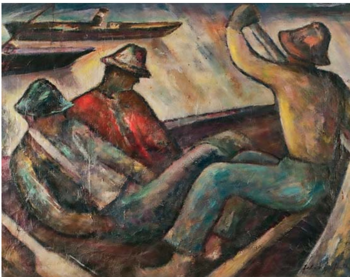
Feleky Fetter Frigyes – Csónakosok a Dunán; 1940-es évek; olaj, vászon; 100×120 cm