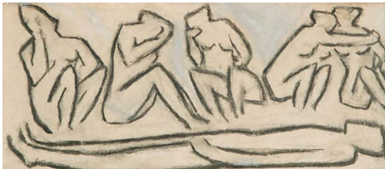
Feleky Fetter Frigyes – Férfihalál; 1930-as évek; szénrajz; 14×34 cm