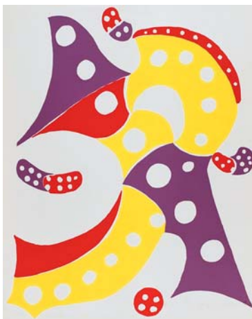
Losonczy Tamás – Kompozíció II.; 1975; szitanyomat; 59,7×49 cm

20 éves az Első Magyar Látványtár Alapítvány. 204. sorszám alatt vette nyilván- tartásba a Fővárosi Bíróság 1990. május 21-én.