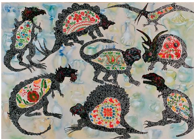
Szirtes János – Gyomorrontás, 1985 vegyes technika; 50x70 cm