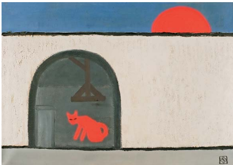
Szemadám György – A vörös macska háza; 1970; olaj, vásznon; 50x70 cm