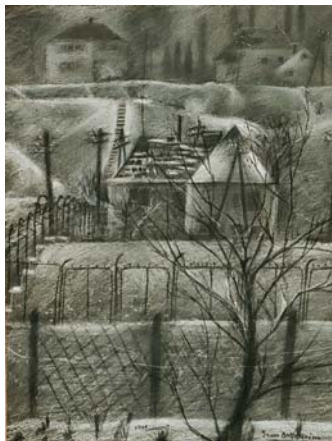
Gross-Bettelheim Jolán – Havas táj, 1960 pasztel, papír; 33x25 cm

A „Budapest Bank Budapestért” Alapítvány támogatásával