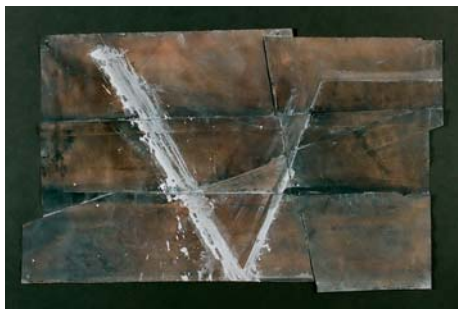
Schmal Károly – Cím nélkül; vegyes technika; 35x53 cm