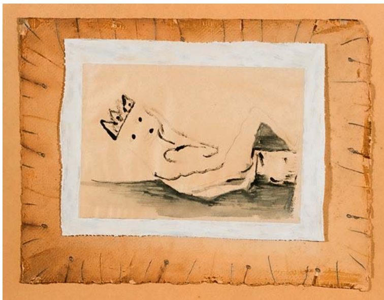
Ganczaugh Miklós – Ecce Homo; 1990; vegyes technika; 32,5×25,5 cm