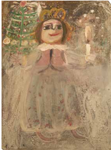
O. Papp Gábor: Cseperke