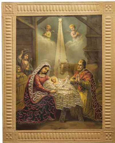
Betlehem, hímezett olajnyomat