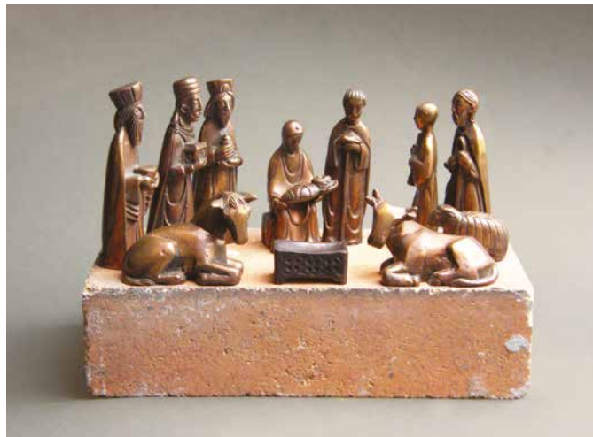
Mátyássy László: Betlehem

Valamint: a népi vallásosság jeles darabjai • fotók • gyerekrajzok • ismeretlen szerzők • látványtári kompozíciók • szövegek • talált tárgyak