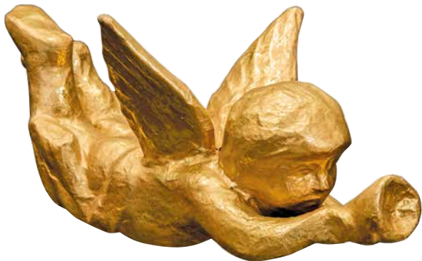
Talált tárgy: Örömhírhöző