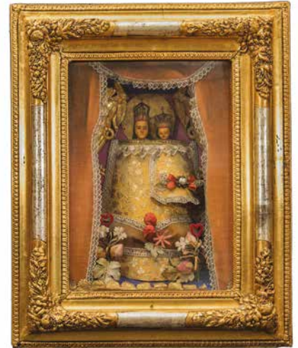
Máriácska, XIX–XX. sz. fordulója