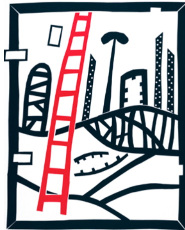
Luzsicza Árpád: Táj pirossal , 2018