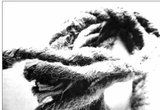
Rába Judit: Oldás - Kötés , 2018