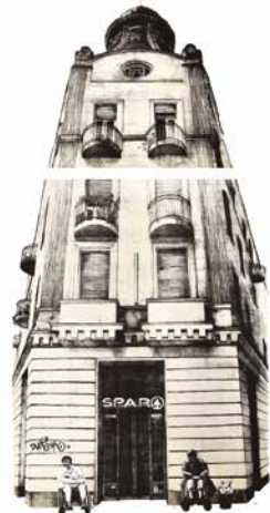
Bányay Anna: Őrzők , 2017