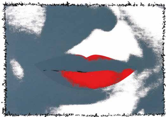
Szőnyi Krisztina: Az enyém... A szájam , 2018