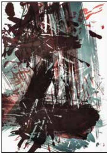
Kiss Zoltán: Kubai zongora, 2012, litográfia, 100×70 cm