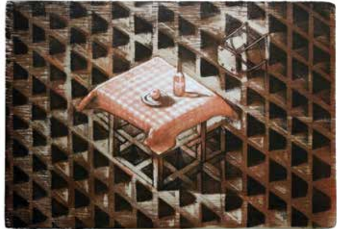
Zsankó László: A dolgok állása , 2011, litográfia, 50×70 cm