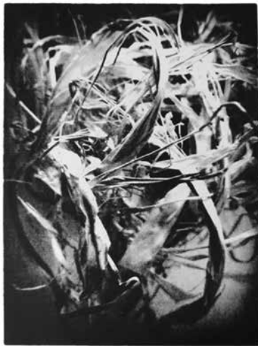
Rába Judit: Időgöcök V. , 2019, szítanyomat, 70×50 cm

A Magyar Grafikusművészek Szövetsége GRAFIKAI KÖZKINCSEK/DIGIT-KLASSZIK 5. '2021 címszó alatt a Magyar Grafikusművészek Szövetsége és A Magyar Grafikáért Alapítvány hagyományaik szerint, ismét egy ritka különlegességet kíván bemutatni a művészetek kedvelőinek illetve a grafika iránt érdeklődők számára.