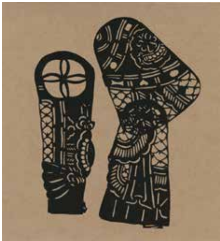
Illés Anna: Nyomatok, 2020, szitanyomat, 30×30 cm