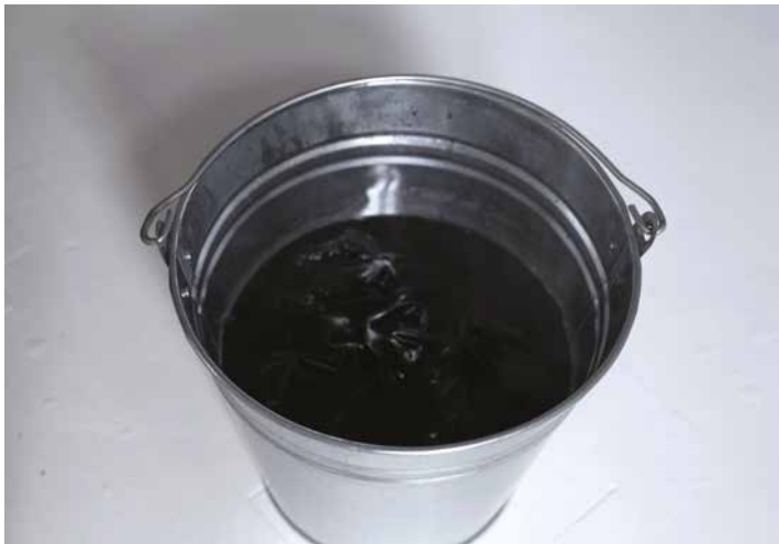
Asztalos Zsolt: Egy gyászlobogó felújítása II., 2016