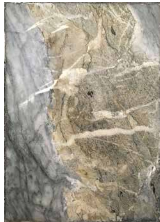
S. L. emlékére, 2020, 4 db digitális nyomat, 70×50cm