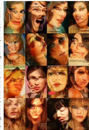
Újságportrék, 2012-2020, 16 db digitális nyomtat, 20x30cm

1987 Roboz Zsuzsi-alapítvány pályázat, Rézkarcoló Művészek Alkotóközösségének különdíja, Budapest • 1989 Magyar Képzőművészeti Főiskola ösztöndíja, Olaszország • 1992 Barcsay Jenő-díj, Szentendre • 1993 Herman Lipót-díj, M.K.F, Budapest • 1995 Mitológia c. pályázat II. díj, Debrecen • 1996 Bíró Miklós-díj, Vajdaság • 1997 III. Országos Pasztell Biennálé fődíja, Esztergom • 1999 IV. Magyar Groteszk, Magyar Festők Társasága díja, Kaposvár • MAOE díja, Hódmezővásárhely • 2004 VOX Artis alapítvány díja, Budapest • 2005 Bp. XVII. ker. Önkormányzata kiállítási díja, Budapest • 2009 35. Nyári Tárlat fődíja • Oktatási és Kulturális Minisztérium Művészeti Főosztály díja, Szeged • 2019 Damjanich János Múzeum különdíja, Szolnok • 2020 Pilinszky-emlékérem Budapest • Belváros-Lipótváros Budapest Főváros V. kerület Önkormányzatának díja