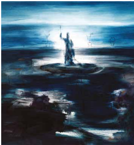
Szotyori László: Kert III. /Tivoli/, 2015, olaj, vászon, 95×115 cm