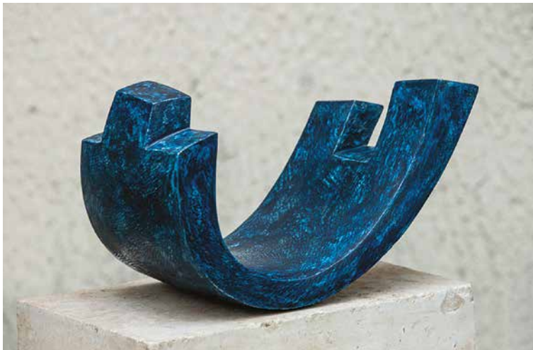
Kalmár János: Intervallum IV., 2016, geopolimer, 12×23×13 cm