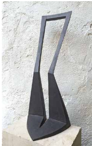
Kalmár János: Intervallum VIII., 2016, geopolimer, 43×18×14 cm