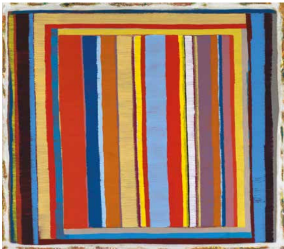
Jutta Obenhuber: Csíkos kép, 2017, olaj, fém, 70x80 cm