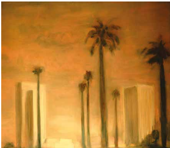
Szotyory László: Képzés és kiállítás, 2013, olaj, vászon, 60x75 cm