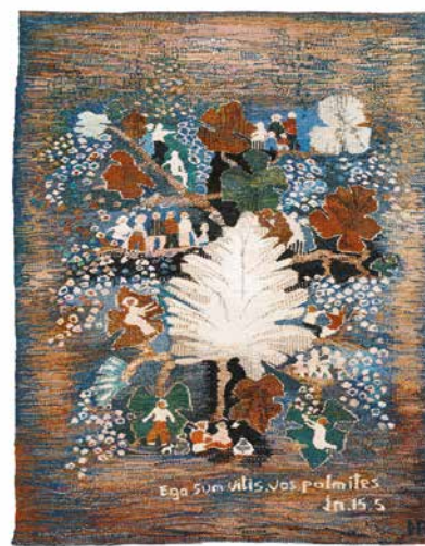
Én vagyok a szőlőtő, ti a szőlővesszők (Jn.15:5)

Hager Ritta: Trilógia, gobelin, 2015-2017, 120×90 cm