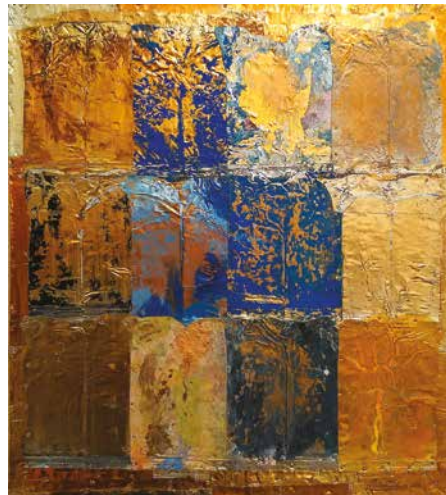
Pataki Ferenc: Égi mező, 2014, akril, metál, fa, 40×36 cm

Ennek az egyetemes romlásnak a folyamatát tehát Hamvas a művészet erejével kívánta megállítani. Mert: „a művészet nem a valóság (természet) utánzása, a művészet nem kifejezés (pszichológia, modernizmus), hanem az eredeti valóság