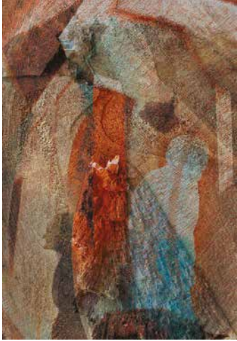
Ries Zoltán: Átlényegülés , 2018, elektro(n)grafika, 60×40 cm