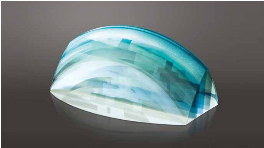
Bohus Zoltán: Keresztek, 2015, ragasztott üveg, 16×32×22 cm