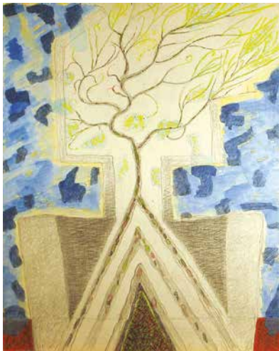
Ganczaugh Miklós: Imádkozó, 2012, tempera, 67,5×49,5 cm