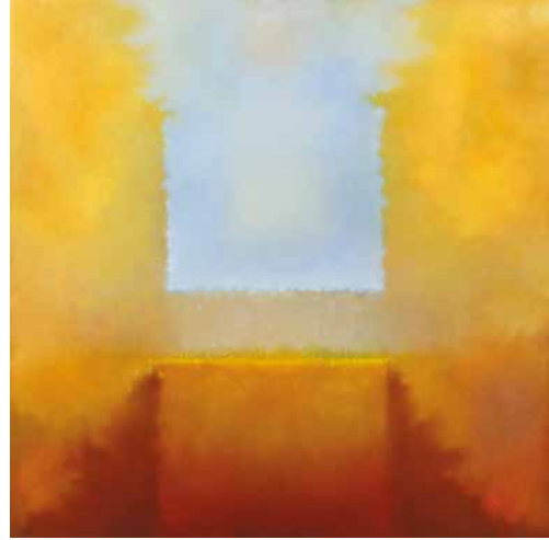
Kovács-Gombos Gábor: ...Közeledik a hajnal , 2017, olaj, 80×80 cm