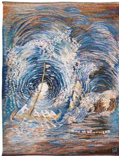
Evez a mélyre