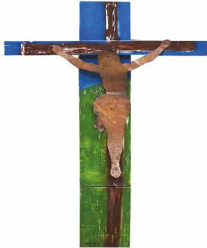
Luzsicza Árpád: Óbudavári pléhrisztus , 2002, 220×170 cm