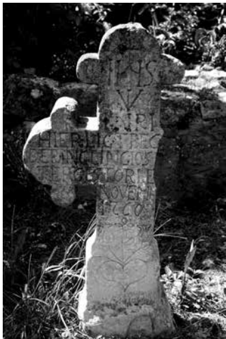
Aknay Tibor: Mecseknádasdi temetőben II., fotó, 50x40 cm