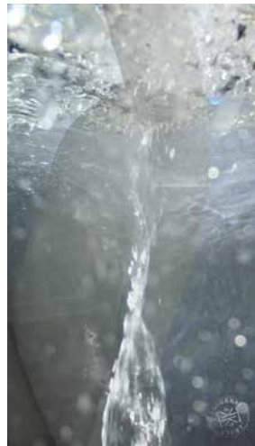
Koroknai Zsolt: Felületsértések, 2018, videó, 1:50 min.