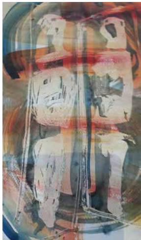
Sinkó István: Zárt figurák , akvarell, 2016, 30x20 cm