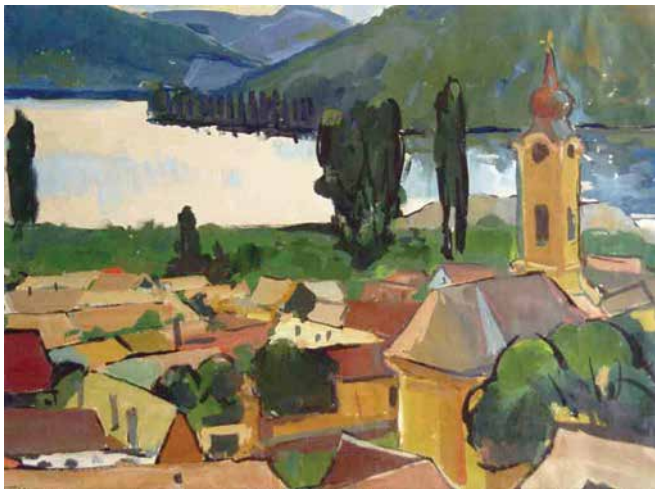
Sínkó Károly: Dunakanyar, 1966, tempera, 45×60 cm