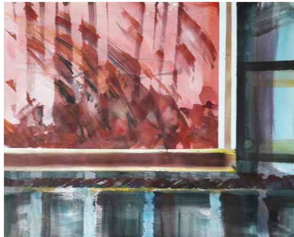
Sinkó István: Forradalom az ablakból I. , 2016, akvarell, 50x70 cm