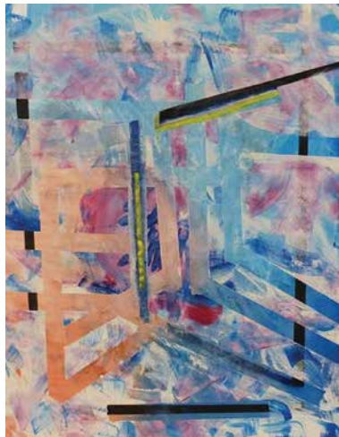
Sinkó István: Tavaszi ablakkeretek , 2015, akril, 120x100 cm