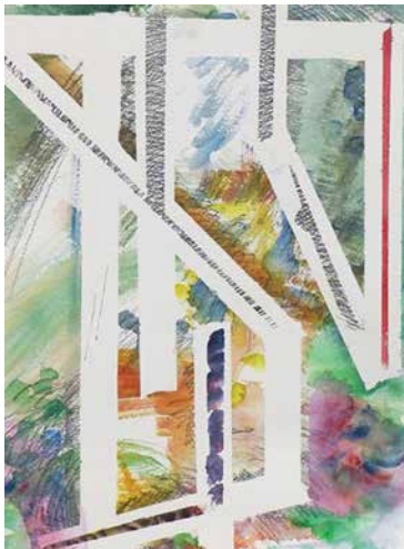
Sinkó István: Álomtő redék ablakokkal, 2015, akvarell, 70x50 cm