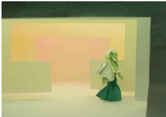
Mátrai Erik: acbspace , 2016, installáció