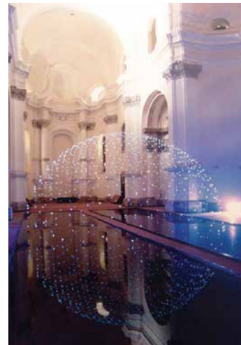
Mátrai Erik: Gömb, 2011, cérna, UV-reagens papír, UV-fény, víz