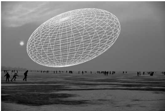
Mátrai Erik: Ellipszoid , 2012, fotó