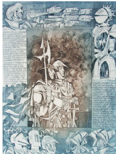
Kass János: Hamlet, Az órség, 1980, rézkarc, 38x29 cm

Grafikai munkássága széles spektrumot ölelt át technikailag és tematikailag egyaránt. Készített könyvillusztrációkat, bélyegterveket, rézkarc illusztrációkat az Ótestamentumhoz, Madách Imre Az ember tragédiája drámájához, szitanyomat illusztrációkat Bartók Béla A Kékszakállú herceg vára zenemű szöveggönyvéhez, tankönyv illusztrációkat, fém, kő és műanyag szobrokat. 1970 -1981 között a Magyar Iparművészeti Főiskola tanára. Készített animációs filmet a Halas and Batchelor londoni stúdióval együttműködve. 1985-től Szegeden megalapította a Kass Galériát. Gazdag, változatos életművéből ez alkalommal csak ízelítőt tudunk bemutatni.