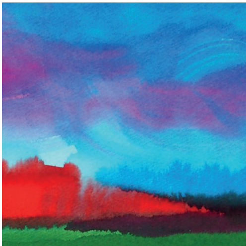
Kass Eszter: Az út fölött az ég, 2015, olaj, vászon, 40x60 cm