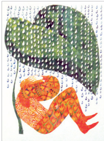
Hajnal Gabriella: Magyar Népmesét (Móra), 1975, tus, 25x18 cm

Egyéni kiállítások: 1976 Gallery Object, Winterthur, Svájc • 1977 Bartók Béla Művelődési Központ, Szeged • 1978 Műcsarnok, Budapest • 1979 Sin'paora Gallery, Paris • 1980 Palais des Arts et de