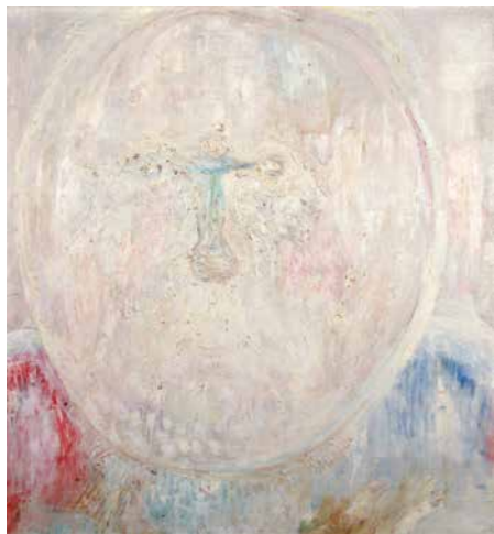
Korongfej, 1970 körül, vászon, olaj, 80x75 cm

„Ma vettem észre, hogy az embereket állatokhoz hasonlóan kell látnom, mint Nyulit, ha részvétellel akarok lenni irányukban.” „Hogy megtaláljuk azt, ami egy fejben érdekes, azaz a lelket, előbb a különböző alaprészeket kell megkeresnünk. A külső alak alatt a megfelelő állatot.”