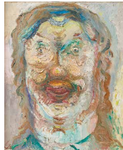
Ősöm, 1950/1958, vászon, olaj, 60.5x50.5 cm