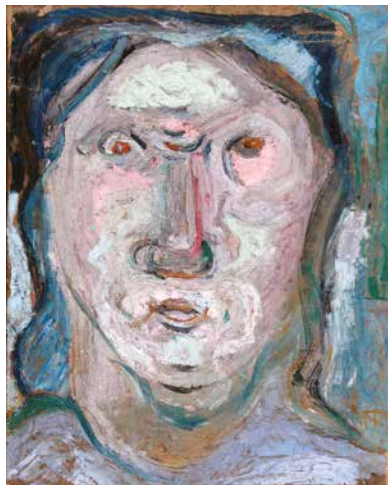
Édesanyám, 1962 körül, vászon, olaj, 50x40 cm

a főiskolai évek után önként kivonult a már akkor is egészségtelen módon Budapest-központú magyar művészeti életből, s egy 1941-es fővárosi kiállítástól eltekintve gyakorlatilag három évtizedre eltűnik a szakma és a nagyközönség szeme elől. A Bánszky Pál által „prófécialás” kifejezéssel illetett első korszakban készült művek világosan megmutatják azt, hogy a falu vallásosságának, az azzal összefüggő, döntően késő középkori eredetű vizualitásnak, milyen jelentős szerepe volt a festő művészi képzelet- és formavilágának kialakulásában. Nem meglepő tehát, hogy korabeli „portréi” közül többet is a népi motívumokkal is átítatott keresztény ikonográfia keretében értelmezhetjük, így például A jó kovácsot A megsebzett címmel megfestett – kultikus eredetű – Krisztus-arckép profán változataként, mint a Megváltót követő hívő és jó szándékú ember példázata. De ekkor születik – egymáshoz képest teljesen eltérő felfogásban – két jelentős korai önarcképe is, az Ifjúkori önarckép és az Önarckép .