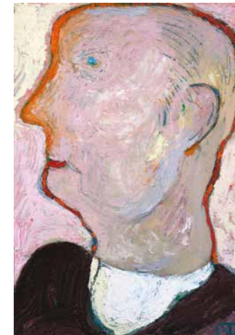
Kopasz, 1969, papír, olaj, 42×29 cm