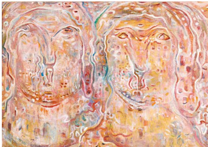
Kettős arckép, 1943 körül, papír, olaj, 33×61 cm