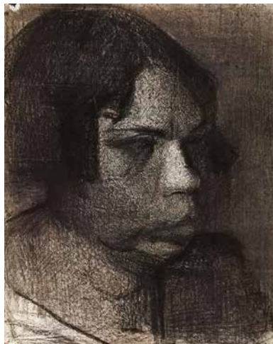
Tanulmányfej II., 1933/34 körül, szén, 60x40 cm

a munka, a neki adatott mondandó megfogalmazása. Ezért nem változott meg az öregkori ünneplések idején sem; maradt, aminek indult: a festészen keresztül az élet titkait kereső parasztnő. Mert a festészet Tóth Menyhért számára nem csupán önmegvalósítás, hanem megismerés, filozófia is volt.” (Németh Lajos) Tóth Menyhért művészetét csupán a hatvanas években kezdtek el szélesebb körben felfedezni, megismertetni, s mélységében még ma is tart. Ennek egyik fő letéteményese, mindenekelőtt gyűjteményi téren, a Kecskeméti Katona József Múzeum, ahová 1974-től kezdve vásárlás, majd ajándékozás, végül 1981 után hagyatéki útján került a többeszes életmű mintegy kilencvenöt százaléka. A hatalmas múzeumi kollekciónak ezúttal Tóth Menyhért fejeiből (portréiból) mutatunk be egy szerény válogatást. Kiállításunkon a hangsúlyt az ötvenes évek második felében és a hatvanas évek első két harmadában készült fej-sorozatára helyeztük, mivel azonban a téma mindvégig jelen volt a „miskei Anteusz” életművében, egy-egy alkotás segítségével az előzményeket, illetve a kései utözöngéket is érzékeltetni kívántuk.